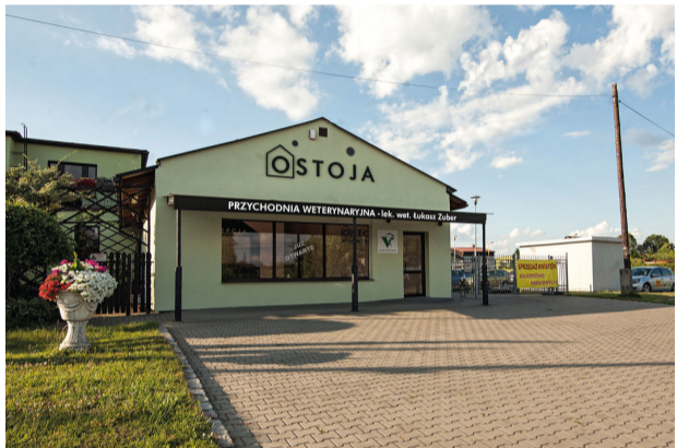
Budynek przychodni „Ostoja”

Otrzymane środki były dla nas dużym wsparciem. Dzięki nim mogliśmy zakupić wysokiej jakości sprzęt do badania krwi oraz aparat usg, co umożliwi nam szybką diagnozę chorób. Zakupiony sprzęt sprawia, że jesteśmy bardziej konkurencyjni na rynku.