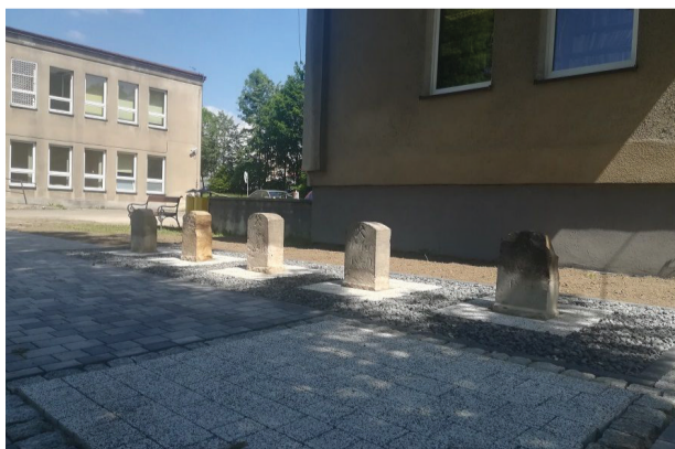
Kamienie kopalniane w Orzeszu