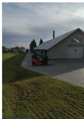
Investycja w firmie Met-Szyk

3. Biorąc pod uwagę cały proces aplikowania o środki oraz samą realizację projektu, który z etapów był dla Państwa najtrudniejszy i dlaczego?