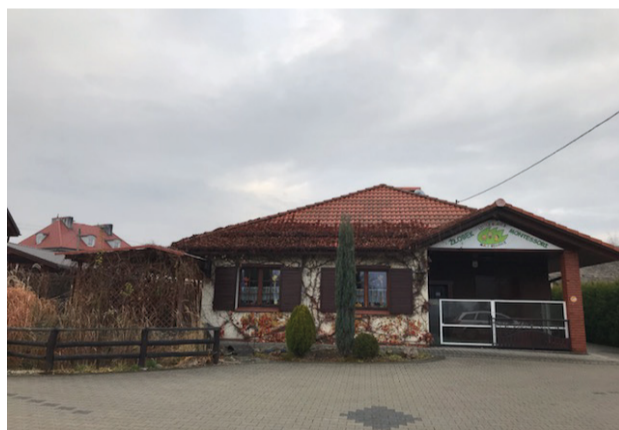
Budynek żłobka w Porębie

Niestety tak. Na ten moment szukam wykwalifikowanych pracowników w innej miejscowości i jest to poważne wyzwanie.