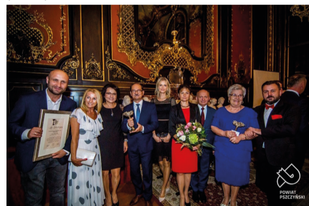
Przedstawiciele LGD „Ziemia Pszczyńska”

wych edycjach uhonorowanych zostało 40 firm mających swoją siedzibę w powiecie pszczyńskim.