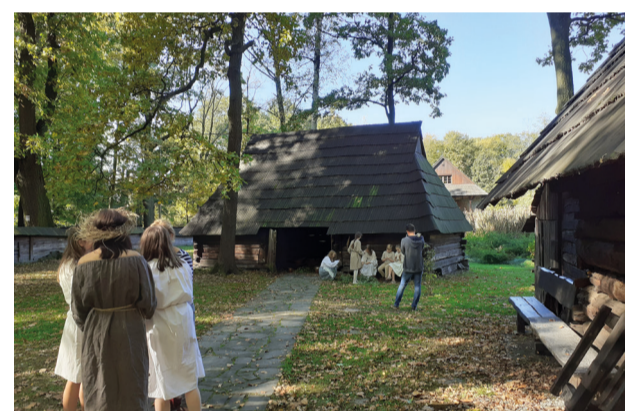
Nagrania w Skansenie - Zagrodzie Wsi Pszczyńskiej, fot. archiwum LGD

Bezpłatne zajęcia odbędą się w Pszczynie, Bojszowach i Ornontowicach. Szczegółowy harmonogram zajęć, zostanie udostępniony w najbliższym czasie, niemniej jednak już teraz zachęcamy do śledzenia informacji o rekrutacji do tego projektu. Wkrótce pojawi się także filmik promujący Akademię, mamy nadzieję, że przypadnie do gustu, głównie naszym przyszłym, młodym Adeptom!:)