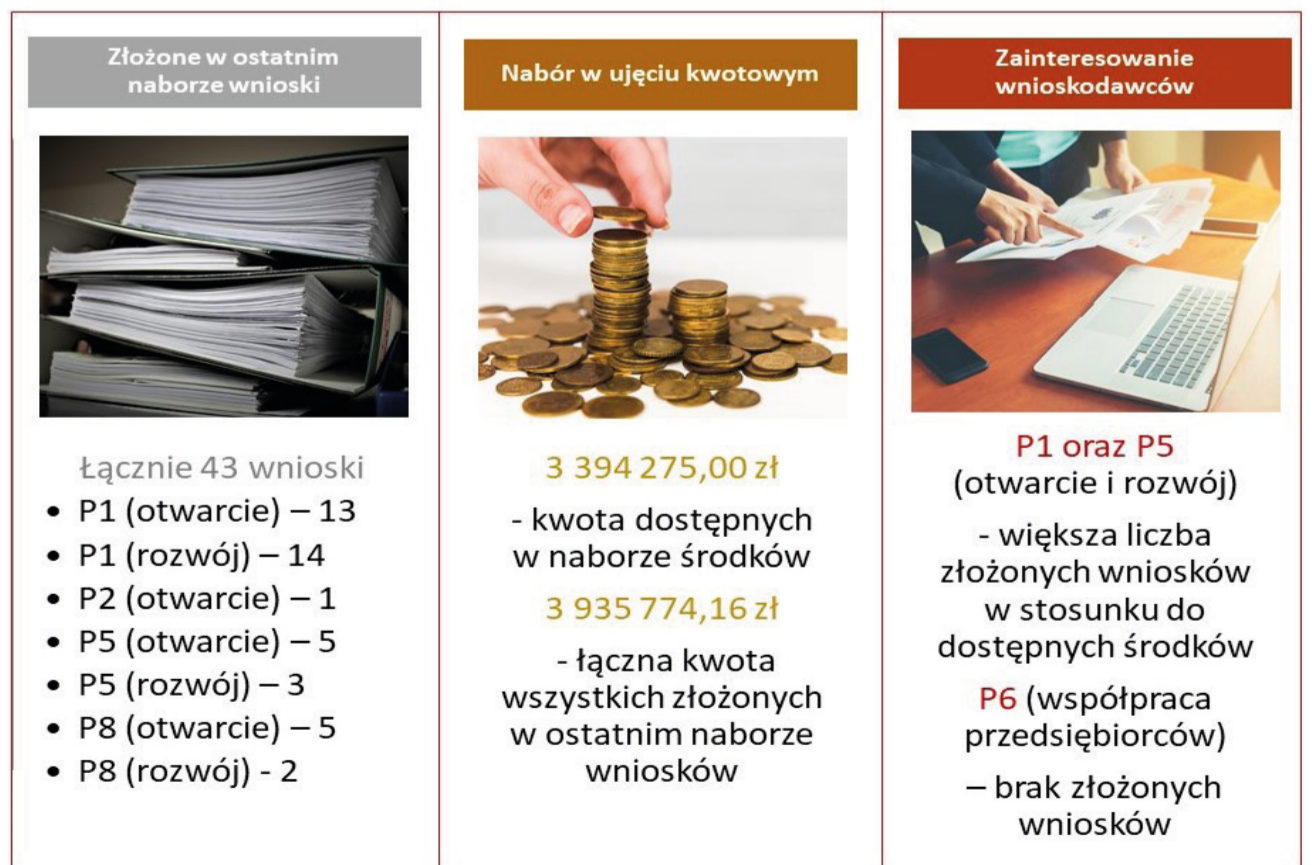
Opracowanie własne LGD fot. Designed by Freepik

mach ostatniego naboru środki w ramach przedsięwzięcia nr 8. Wówczas uruchomione zostaną kolejne nabory wniosków.