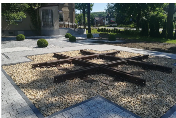
Odtworzone skrzyżowanie torów kolejowych w Orzeszu

W 1884 roku, spółka Kolej Górnośląska oddała do eksploatacji trasę z Orzesza do Żor. W odległości około 500 metrów od stacji Orzesze, trasa ta krzyżowała się z wybudowaną w 1865 roku przez Towarzystwo Kolei Wilhelma, linią łączącą Orzesze Jaśkowice z kopalnią węgla „Gotmintus” (obecnie Kopalnia Węgla Kamiennego Bolesław Śmiały). Wyjątkowość tego skrzyżowania torów, polegała na kącie przecięcia się tras, był to bowiem kąt 90 stopni. Skrzyżowanie przestało działać w 2000 r., a w roku 2010 zostało rozebrane. Dla upamiętnienia tego dość rzadko spotykanego układu torów, Urząd Miejski w Orzeszu odtworzył fragment historycznego torowiska. Projekt, za pośrednictwem LGD „Ziemia Pszczyńska” został współfinansowany ze środków Programu Rozwoju Obszarów Wiejskich na lata 2014-2020. Układ torów można podziwiać w pobliżu budynku urzędu i Miejskiej Biblioteki Publicznej w Orzeszu. Poza torowiskiem, swoje miejsce znalazło tam także kilkanaście kamieni granicznych. Są to kamienie kopalniane, którymi oznaczane były dawne wyrobiska górnicze. Do tej pory znajdowały się one w okolicznych lasach.