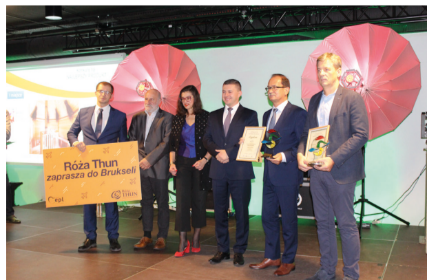
Laureaci nagrody, Kielce 2019