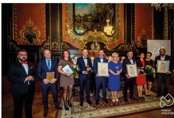
Nagrodzeni Laureaci

Celem konkursu jest promocja przedsiębiorczości oraz popularyzacja gospodarczych osiągnięć najlepszych przedsiębiorców w Powiecie Pszczyńskim. Nagrodzeni otrzymują statuetkę „Laur Przedsiębiorczości”, której autorem jest