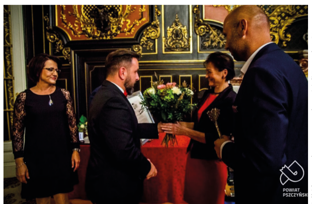
Odbiór nagrody przez przedstawicieli Zarządu LGD

Nasze Stowarzyszenie otrzymało Laur Specjalny, za pośredni wkład w rozwój przedsiębiorczości oraz wsparcie, jakie Stowarzyszenie udziela przedsiębiorcom.