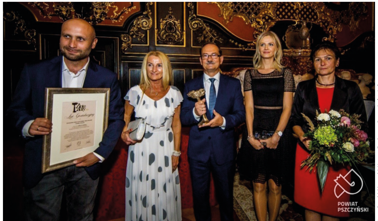
Laury Przedsiębiorczości, Muzeum Zamkowe w Pszczynie

W tym numerze biuletynu przygotowaliśmy kilka wywiadów z naszymi beneficjentami. Jest to bowiem dobra okazja, aby to beneficjenci, za sprawą realizowanych przez siebie projektów, podsumowali niejako ten okres programowania. Dodatkowo, przedstawiamy podsumowanie naszych ostatnich naborów wniosków o przyznanie pomocy. W tym biuletynie znajdą Państwo również tradycyjnie informacje o planowanych w najbliższym czasie działaniach LGD. Początkiem roku ruszy ponownie Akademia Ziemi Pszczyńskiej. W ramach Akademii, odbędą się zajęcia dla dzieci w wieku 9-12 lat, a także inicjatywy to-