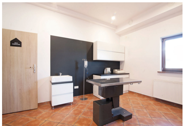
Wnętrze przychodni „Ostoja”

Właściwa diagnoza i zakończone sukcesem leczenie są najbardziej satysfakcjonujące w mojej pracy. Lubię obserwować jak moje wysiłki przekładają się na dobry stan zdrowia i wysoką produktywność pacjentów, którymi się opiekuję. Prowadzenie własnej działalności jest bardzo wymagające ale jednocześnie pozwala na pracę na własnych warunkach.