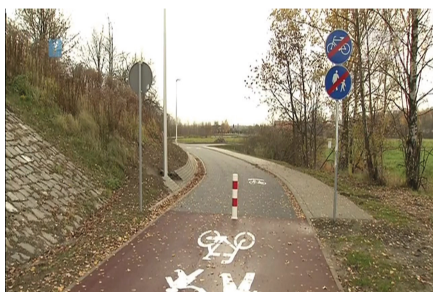
Gmina Bieruń, ścieżka rowerowa, fot. archiwum TVP 3