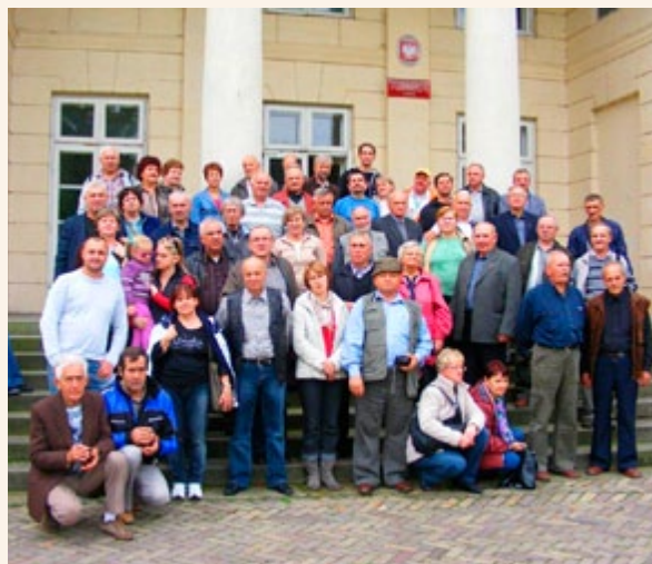
Wyjazd pszczelarzy do Pszczelej Woli

Pozostałe wyjazdy dotyczyły wyjazdów studyjnych do LGD w Austrii, na Morawach oraz w Nadrenii. Ze wszystkich wyjazdów uczestnicy przywieźli certyfikaty i nowe doświadczenia w zakresie interesujących ich tematów.