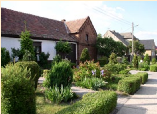
Zwycięska wieś w kategorii Najpiękniejsza wieś lubuska – Podmokle Małe – Gmina Babimost (ARCHIWUM SR KSOW)