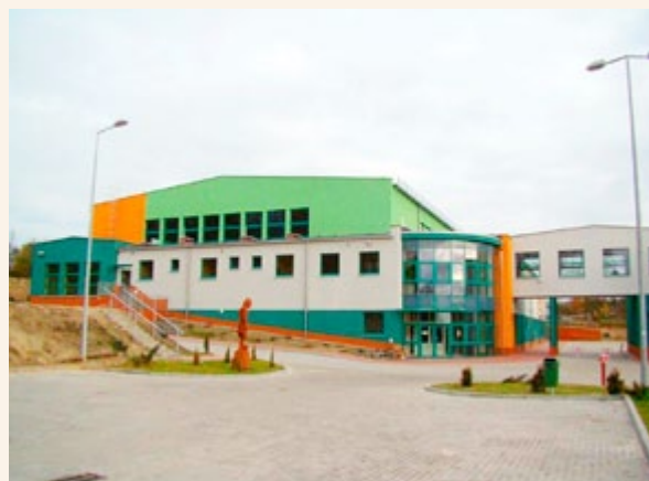
Zwycięski projekt konkursu Przyjazna Wieś 2011 – hala sportowa w Świdnicy

a mieszkające w nich społeczności są aktywne i dobrze zorganizowane. Wspólne projekty i działania mieszkańców pokazały, jak można korzystać z funduszy unijnych oraz jak można zebrać się i stworzyć coś razem dla swojej wsi i swojego regionu, jednocześnie kultywując regionalną historię i kulturę. Kolejnym ważnym konkursem jest: „Przyjazna Wieś”, którego zwycięzcą w kategorii społecznej została w tym roku gmina Świdnica i jej projekt hali sportowej. Z wybudowanej hali, w której prowadzone są między innymi zajęcia szermierki, jogi, aerobiku itp., mogą korzystać nie tylko mieszkańcy Świdnicy, ale także wszyscy chętni. Zaś w kategorii technicznej zwyciężył projekt gminy Czerwieńsk.