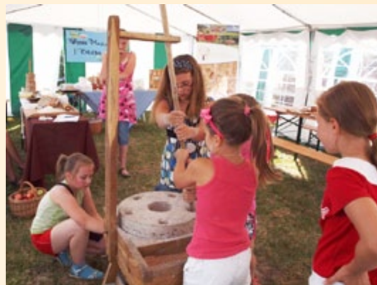
Opolski Jarmark Folkloru

Zorganizowano także plener rzeźbiarski, podczas którego każdy mógł choć na chwilę stać się prawdziwym artystą i spróbować trudnej sztuki rzeźbiarskiej, która wymaga wielkiej precyzji, cierpliwości i wytrwałości. Przez cały dzień na scenie odbywały się występy kabaretów i zespołów ludowych, orkiestry dętej z Łowkowic oraz gościnnie wystąpił zespół z miasta partnerskiego na Ukrainie. Przeprowadzono konkurs kulinarny pn. „Kuchnia miodem płynąca” na najlepszą potrawę z wykorzystaniem miodu, a liczne stoiska wystawiennicze oferowały odwiedzającym Jarmark smaczne produkty tradycyjne oraz piękne wyroby rękodzielnicze.