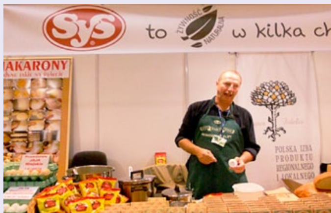
Demonstracja produktu lokalnego – projekt „Produkty lokalne”

interesował nawet samorządy województw, które w 2011 roku przymierzają się do wdrażania w poszczególnych województwach programu „Mój rynek” uruchomionego przez Ministerstwo Rolnictwa i Rozwoju Wsi ze środków PROW 2007-2013.