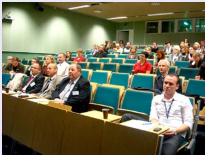
Grupa Wymiany Doświadczeń w Gdyni