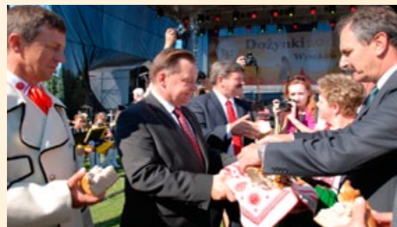
XIII Dożynki Województwa Mazowieckiego