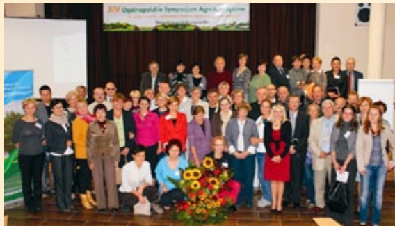
Uczestnicy XIV Ogólnopolskiego Sympozjum Agroturystycznego

zjum. Podczas 3-dniowego sympozjum wypracowano nowe spojrzenie na gospodarkę wiejską oraz miejsce i rolę turystyki w jej kreowaniu. Wizyta w województwie zachodniopomorskim pozwoliła wszystkim uczestnikom zapoznać się z rezultatami działań na rzecz tworzenia produktów markowych i ograniczenia wykluczenia społecznego przy pomocy aktywizacji turystycznej mieszkańców wsi.