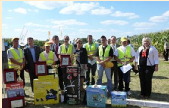
Zwycięzcy konkursu orki

W niedzielę 4 września br. na polach demonstracyjnych w Szepietowie po raz czwarty odbył się Konkurs orania pługami tradycyjnymi zorganizowany przez Sekretariat Regionalny Krajowej Sieci Obszarów Wiejskich przy wsparciu Podlaskiego Ośrodka Doradztwa Rolniczego w Szepietowie. Głównym celem konkursu jest popularyzacja dobrze wykonanego zabiegu uprawowego, jakim jest orka. Konkurs orania pługami tradycyjnymi, który towarzyszył w tym dniu Świętu Kukurydzy, był jego znaczącą atrakcją. Święto przyciągnęło rzesze rolników, plantatorów, firmy nasienne i maszynowe. Zmagania finalistów, którzy zostali wyłonieni w eliminacjach rejonowych, obserwowaliśmy na polach demonstracyjnych. Konkurs orki był okazją dla uczestników do pogłębiania wiedzy z zakresu doboru właściwych odmian kukurydzy i innowacyjnych metod uprawy, które zwiększają efektywność produkcji. Jak zawsze zainteresowani rolnicy mogli skorzystać z porad doradców i przedstawicieli firm z zakresu produkcji i zbioru upraw, a także uzyskać pomoc w rozwiązywaniu problemów napotykanym w trakcie uprawy.