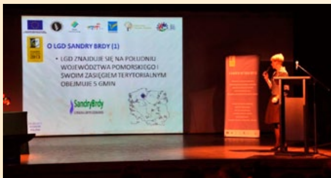
Międzynarodowa konferencja Leader

Organizatorzy i partnerzy konferencji są przekonani o dużym znaczeniu podejścia Leader dla sprostania aktualnym wyzwaniom, które stoją przed obszarami wiejski-