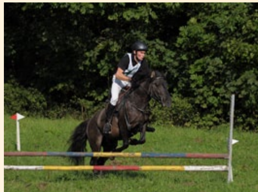
Konkurs skoków przez przeszkody

W części hodowlano-jeździeckiej Pikniku zorganizowana została ocena hodowlana koni rasy konik polski (ocena płytowa), próba dzielności dla koni chcących uzyskać licencje hodowlane, zawody w powożeniu bryczkami parokonnymi, skoki przez przeszkody, a także pokaz wykorzystania koników polskich do jazdy w trudnym terenie, czyli „Na jasielskiej ścieżce konika polskiego”. Imprezie towarzyszyły pokazy konne, m.in. wykorzystanie konika polskiego w hipoterapii. Podczas Pikniku odbył się kiermasz rzemiosła i rękodzieła ludowego, sprzętu rolniczego i ogrodniczego, prezentacje i promocje lokalnych firm, kiermasz roślin ozdobnych, wystawa żywności oraz prezentacje produktów lokalnych.