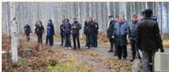
Wizyta w gospodarstwie leśnym

Seminarium miało trzy fazy. Pierwszego dnia w Muzeum Leśnictwa w Lusto prezentowane były działania poszczególnych krajów w zakresie pozyskiwania źródeł energii odnawialnej z terenów leśnych. Omawiano technologie prac w lasach, a także wpływ pozyskiwania surowców energetycznych z obszarów leśnych na wzrost dochodów rolników. Drugi dzień poświęcony