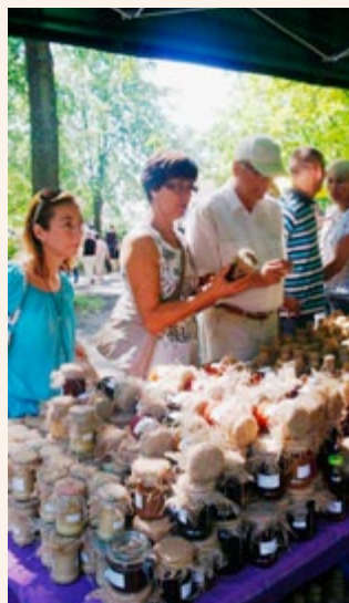
Jarmark Produktów Regionalnych

unijnych funduszy w ramach Programu Rozwoju Obszarów Wiejskich na lata 2007-2013. W kolejnych odcinkach autorzy przedstawiali inwestycje realizowane dzięki unijnym dotacjom, które wpływają na poprawę życia Lubuszan. Audycje emitowane były na antenie telewizji w paśmie programów lokalnych oraz stacji lokalnych, są dostępne do wglądu na