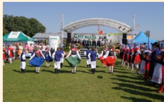
Podczas Targów zaprezentowały się lokalne kapele i zespoły ludowe

Ponadto jak co roku Targom towarzyszył szereg imprez dodatkowych: IX Wystawa Bydła Mlecznego, Pokaz ptaków hodowlanych i ozdobnych oraz królików, Pokaz Zwierząt Hodowlanych, VIII Zachodniopomorska Wystawa Hodowlana Koni, Zawody Jeździeckie w Skokach, Pokaz Psów Myśliwskich, III Wystawa Królików, Konkurs Młodego Hodowcy, Konkurs Moja Mleczna Kraina, Piknik zbożowy, Dożynki Wojewódzkie, Korowód wieńców dożynkowych, VI Międzynarodowa Wystawa Rękodzielnictwa, Wystawa Malarska i Warsztaty Baltic Deal.