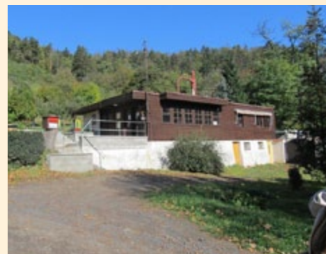
Instytut Pszczelarstwa w Dol