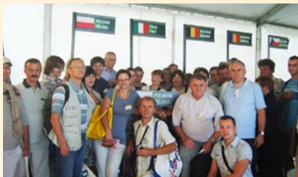
Uczestnicy wyjazdu studyjnego do Francji