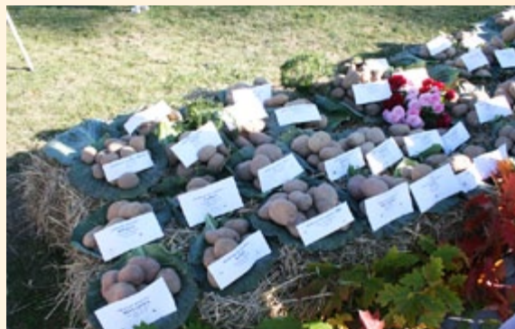
V Święto Ziemniaka w Trzyciążu