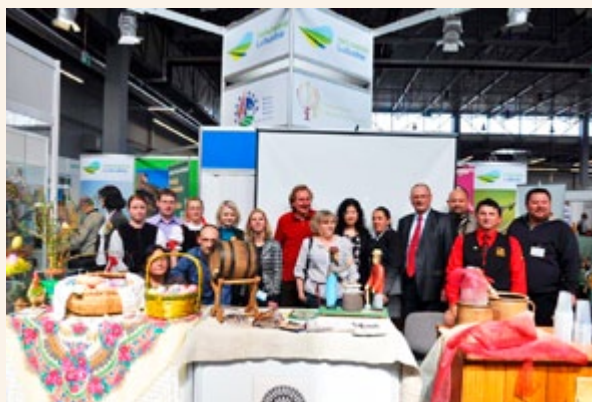
Targi AGROTRAVEL 2011