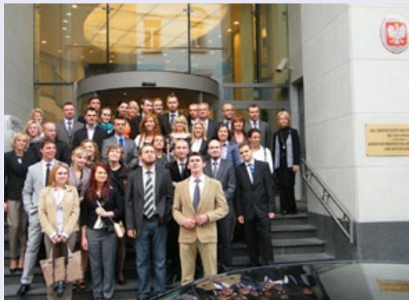
Uczestnicy wyjazdu przed Stałym Przedstawicielstwem Polski przy UE