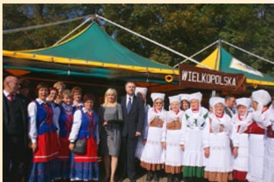
Na dożynkach w Spale