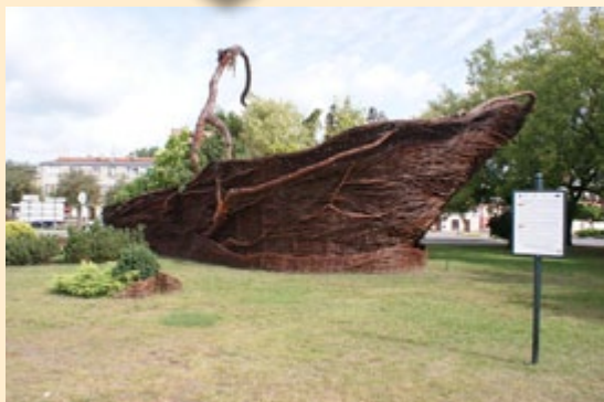
II Światowy Festiwal Wikliny i Plecionkarstwa