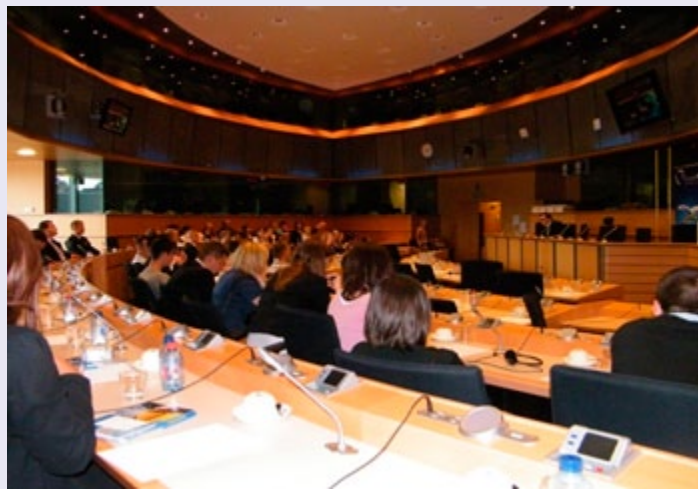
Uczestnicy spotkania z przedstawicielem DG AGRI w Parlamencie Europejskim

rolników, przedsiębiorców wiejskich, radnych, sołtysów, przedstawicieli lokalnych organizacji pozarządowych,