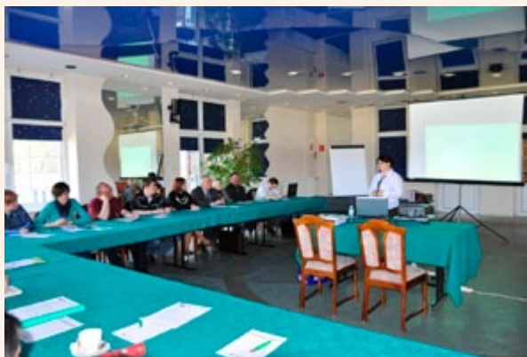
Szkolenie dla LGD