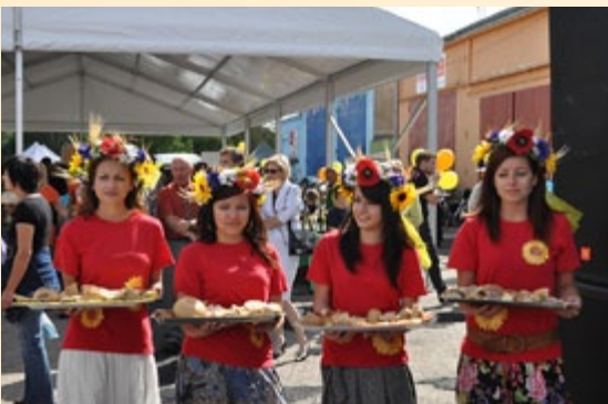
Lubuski Dzień Żywności

Po długich negocjacjach Komisja Konkursowa (składająca się z przedstawicieli SR KSOW, Departamentu PROW, Lubuskiego Stowarzyszenia Sołtysów, Lubuskiej Izby Rolniczej oraz Lubuskiego Ośrodka Doradztwa Rolniczego) wybrała i nagrodziła 3 zwycięskie wsie oraz 3 najciekawsze projekty Odnowy. Uroczyste podsumowanie konkursu wraz z wręczeniem nagród odbyło się na konferencji w siedzibie Urzędu Marszałkowskiego woj. lubuskiego w dniu 26 października br.