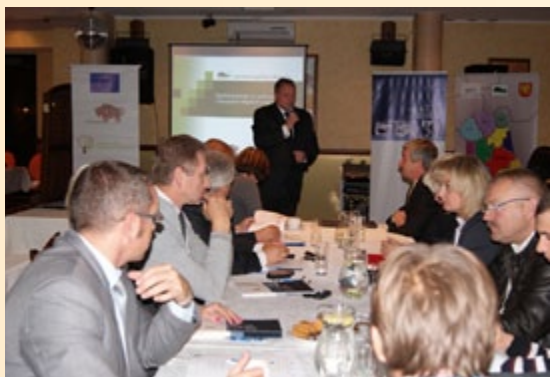
Konferencja w sprawie aktywizacji obszarów wiejskich

W ramach organizowanego przedsięwzięcia zaplanowano siedem konferencji w powiatach województwa podlaskiego, z największym udziałem bezrobotnych zamieszkałych na terenach wiejskich. Tematem przewodnim konferencji jest problem wysokiego bezrobocia, małej mobilności zawodowej, niskich kwalifikacji, co w bardzo dużym stopniu dotyka mieszkańców wsi. Poruszone zostały tematy ogólnej sytuacji na rynku pracy i obszarów wiejskich w woj. podlaskim oraz sytuacji na rynku pracy mieszkańców obszarów wiejskich. Przedstawione zostały odnawialne źródła energii jako szansa rozwoju obszarów wiejskich. Ponadto prezentowane były dobre praktyki oraz ukazana rola organizacji społecznych i mikroprzedsiębiorstw w procesie dynamizowania i rozwoju obszarów wiejskich. Wskazane zostały także możliwości oraz źródła finansowania działalności gospodarczej. Na koniec spotkań odbywają się debaty i dyskusje z udziałem ekspertów i wykładowców.