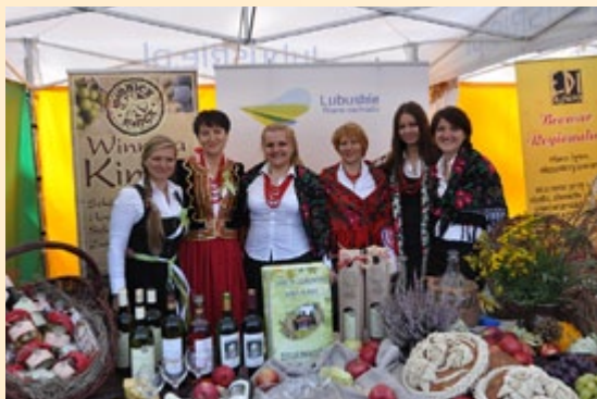
Na Dożynkach Prezydenckich w Spale

21 sierpnia br. był dniem obfitującym w produkty regionalne i tradycyjne. SR KSOW we współpracy z Zielonogórskim Rynkiem Rolno-Towarowym zorganizował w Zielonej Górze – Lubuski Dzień Żywności. W niedzielne przedpołudnie każdy chętny mógł bezpłatnie odwiedzić teren ZRRT i spróbować przepysznych potraw oraz produktów żywnościowych z terenu woj. lubuskiego. Było pieczywo, miód, wędliny, wyroby mączne, piwo i wino regionalne. Nikt, kto opuszczał imprezę, nie odchodził z pustym brzuchem. A i dla ducha też coś się znalazło, m.in. występy regionalnych zespołów prezentujących swój dorobek śpiewaczy (Wierzbiczanki czy Kapela Górali Czadeckich). Impreza zakończyła się ogromnym sukcesem.