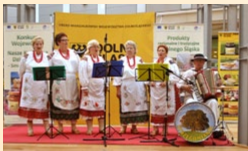
Podsumowaniu konkursu towarzyszyła oprawa artystyczna

Realizując działanie Krajowej Sieci Obszarów Wiejskich pn. Identyfikacja i analiza możliwych do przeniesienia dobrych praktyk w zakresie rozwoju obszarów wiejskich oraz przekazanie informacji na ich temat zrealizowano na Dolnym Śląsku etap regionalny konkursu pn. Nasze Kulinarne Dziedzictwo – Smaki Regionów. Celem konkursu było poznanie i udokumentowanie dolnośląskich regionalnych produktów żywnościowych, produktów osadzonych głęboko w polskiej tradycji i od lat wytwarzanych tymi samymi metodami i według tych samych receptur. Jego ideą było też przygotowanie producentów do ubiegania się o ochronę zgodną z ustawodawstwem unijnym oraz zachęcanie mieszkańców obszarów wiejskich do poszukiwania alternatywnych źródeł dochodu. Jury oceniło 65 produktów i 12 potraw wybierając i wyróżniając te najlepsze. Oprócz przyznanych nagród i wyróżnień miały miejsce również nominacje do nagrody „Perła 2011”. Uroczyste podsumowanie etapu wojewódzkiego miało miejsce we wrześniu br. w Pasażu Grunwaldzkim we Wrocławiu.