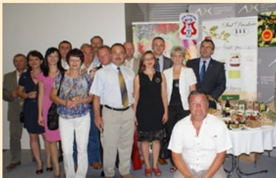
Na targach w Nitrze

W dniach 18-21 sierpnia br. w m. Nitra w Słowacji odbyły się Międzynarodowe Targi Rolno-Spożywcze Agrokomplex 2011. W pawilonie, w którym stoisko wystawiennicze nieodpłatnie udostępniła naszym wystawcom Krajowa Sieć Obszarów