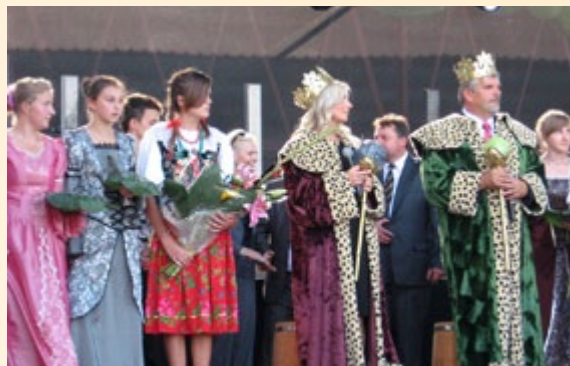
XVIII Charsznickie Dni Kapusty

Sekretariat Regionalny KSOW Województwa Małopolskiego współfinansował V Święto Ziemniaka, które odbyło się w niedzielę 2 października br. w Trzyciążu. Przybyli na przedsięwzięcie goście mogli skosztować potraw i różnych wypieków z ziemniaka przygotowanych przez panie z Kół Gospodyń Wiejskich – wszystkie prezentujące piękne stroje ludowe. Podczas imprezy odbywały się konkursy: kulinarny „Na najlepszą potrawę z ziemniaka” oraz „Ziemniak-rekordzista” – na najokazalszą bulwę. Bogaty program przedsięwzięcia zapewnił jego uczestnikom atrakcje: występy gminnych orkiestr dętych i regionalnych zespołów ludowych oraz stoiska Lokalnych Grup Działania. Świętu towarzyszyły Targi Produktu Lokalnego „Smak Na Produkt” oraz prezentacja nowości technicznych dla rolników. Dla zwolenników zdrowego śmiechu i dowcipu wystąpił kabaret „Smile”.