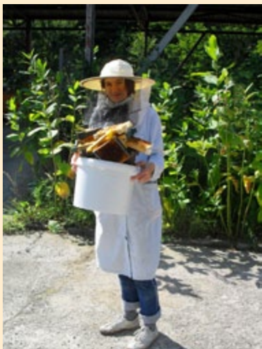
Wyjazd studyjny dla pszczelarzy (ARCHIWUM SR KSOW)

darstw agroturystycznych biorących udział w konkursie opublikowana zostanie w katalogu promującym wypoczynek na wsi, wydanym przez Sekretariat Regionalny KSOW Województwa Łódzkiego jeszcze pod koniec tego roku.