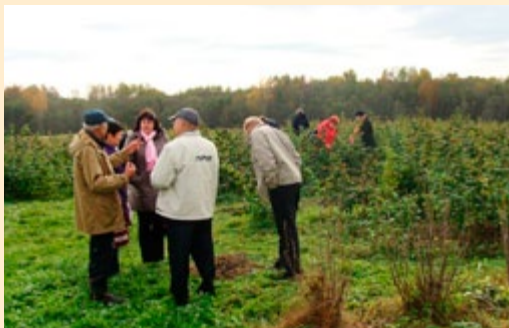
Wyjazd studyjny na Litwę