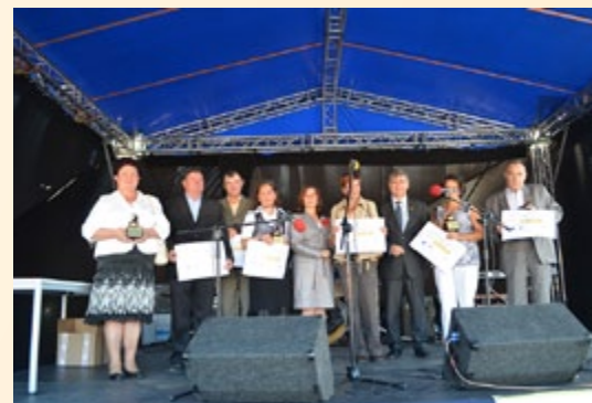
Laureaci „Wojewódzkiego konkursu na najlepsze gospodarstwo agroturystyczne Złota Grusza 2011”