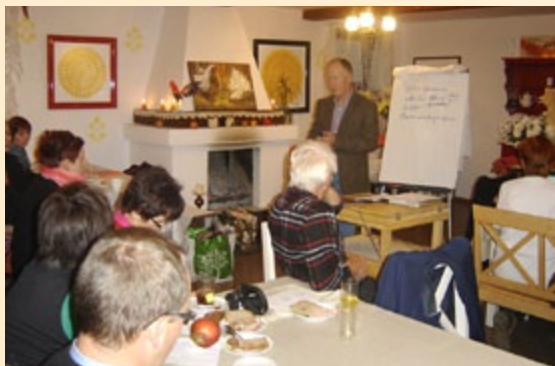
Zajęcia warsztatowe podczas forum

Zwycięzcy konkursu dla gospodarstw agroturystycznych i obiektów turystyki wiejskiej „Agro-Wczasy 2011” w nagrodę mieli możliwość uczestniczenia w dniach 25-29 października w wyjeździe studyjnym do Włoch pn. „Toskania – europejskie centrum agroturystyki, Włochy”.