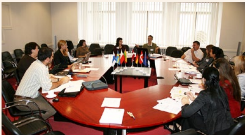
Uczestnicy spotkania w Tallinie

Przedstawicielka polskiej sieci obszarów wiejskich przedstawiła prezentację ukazującą podstawy prawne, strukturę organizacyjną i przykłady podejmowanej działalności zgodnie z Planem Działania, a także stan wdrażania osi priorytetowej 4 programu operacyjnego „Zrównoważony rozwój obszarów zależnych od rybactwa”, realizowanej w ramach Programu ope-